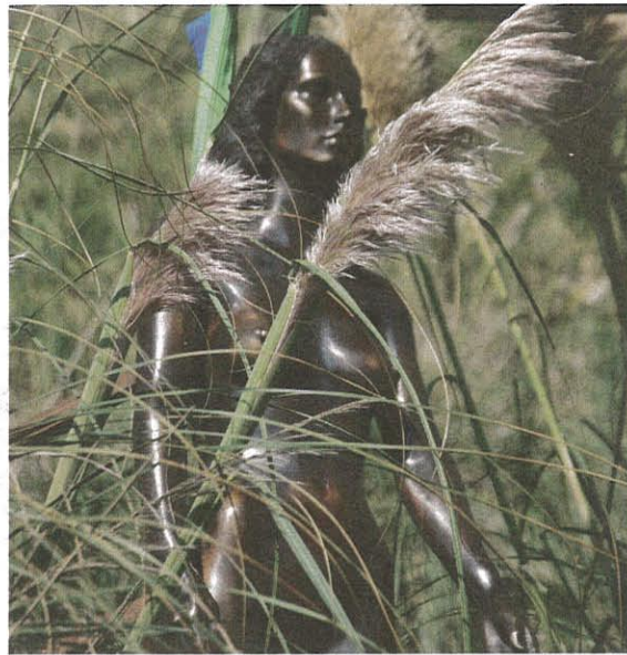
Autre œuvre présentée au-dessus du village vacances.

tion : « Chambre(s) d'Amour ». Les artistes ont été invités à imaginer leur œuvre en résonance à des extraits littéraires, des chansons ou des poèmes choisis par eux.