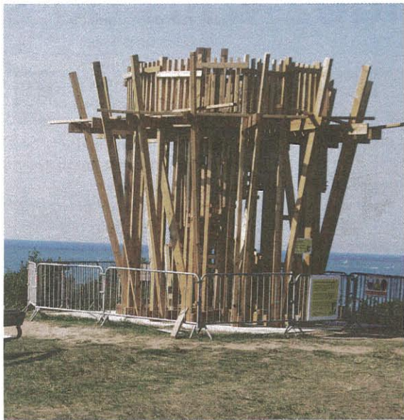
« Love tower » de Tadashi Kawamata au-dessus de la petite Chambre d'amour.